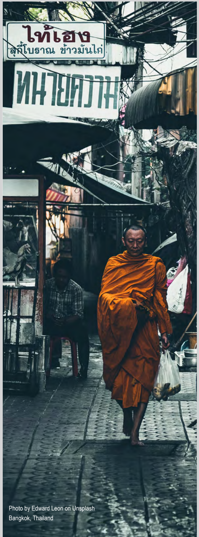
Bangkok, Thailand

針對「打坐」修為而帶出聖經中的潔淨心靈及思想的方法。（差會一位極資深的宣教同工所寫的文章）改編通俗的民間小說作福音預工——泰國人家傳戶曉的一個故事《羅摩基恩——羅摩王子探險記》（英文版為“Ramakien”），原為印度史詩，神話色彩猶似《西遊記》。一位德國宣教同工取其故事大綱，但將人物角色都改編為聖經救贖故事的主要人物，有聖父、聖子、聖靈等等的角色，向年輕人述說，他們都聽得津津有味，並能道出與原故事的分別。