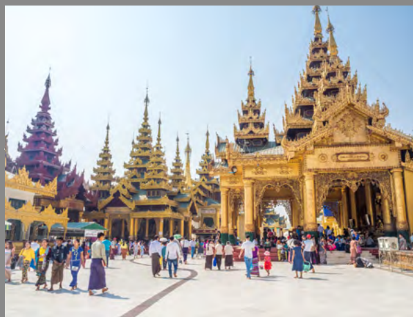
Shwedagon Pagoda, Myanmar

© 香港差傳事工聯會有限公司版權所有 如要轉載，請先與本會出版部聯絡和註明出處。